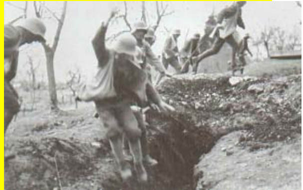
Infanterieangriff am Monte San Gabriele 1917

Besichtigung des Kolovrat, italienische Stellungenanlagen, Freilichtmuseum, bester Platz für die Einweisung über das Gebiet Tolmeiner Brückenkopf (Durchbruch Flitsch - Tolmein).Übernachtung im Raum Tolmein.