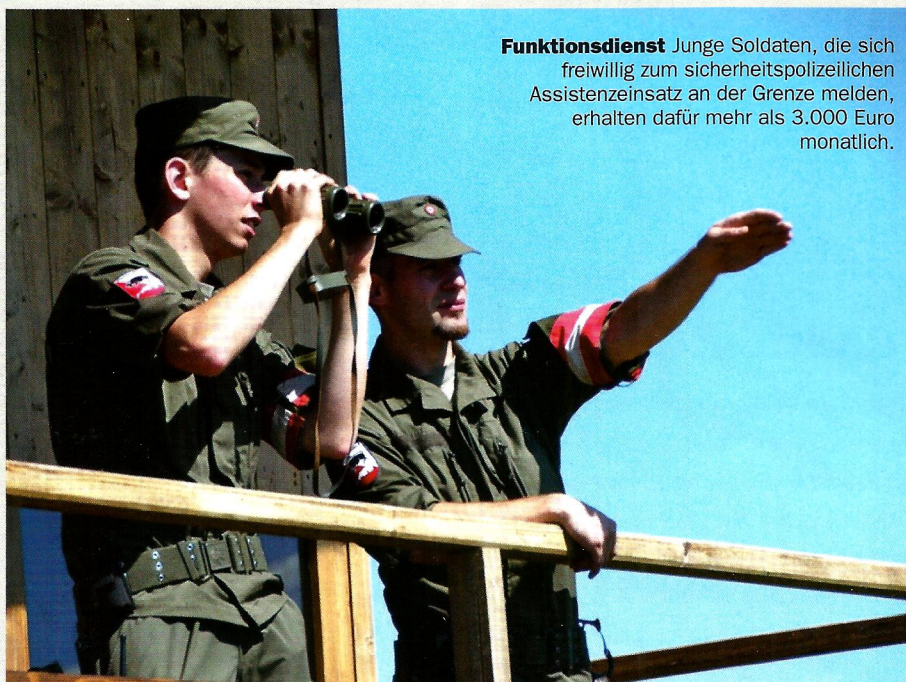
Funktionsdienst Junge Soldaten, die sich freiwillig zum sicherheitspolizeilichen Assistenzeinsatz an der Grenze melden, erhalten dafür mehr als 3.000 Euro monatlich.

Parallel zu den neuen Optionen sollen Grundwehrdiener künftig möglichst wenige Einschränkungen und Verkürzungen ihrer Ausbildungszeit haben und innerhalb des Heeres verstärkt Weiterbildungsmöglichkeiten wahrnehmen können. Assistenzleistungen werden so weit wie möglich reduziert, spezielle Fähigkeiten von Grundwehrdienern wie etwa überdurchschnittliche IT-Kenntnisse gefördert und verstärkt während des Grundwehrdienstes und der Milizfunktion berücksichtigt. Im Zuge dieser breit angelegten Heeresattraktivierung wurde zudem die sogenannte Teiltauglichkeit für stellungspflichtige junge Männer ab dem Jahrgang 2003 realisiert. Für Heer (und natürlich auch Zivildienst) sollen damit jährlich insgesamt bis zu 2.000 zusätzliche Männer zur Vergütung stehen, die mit Einschränkungen für bestimmte Funktionen etwa in Verwaltungsbereichen tauglich sind. Eine finanzielle Besserstellung gibt es dafür allerdings nicht.