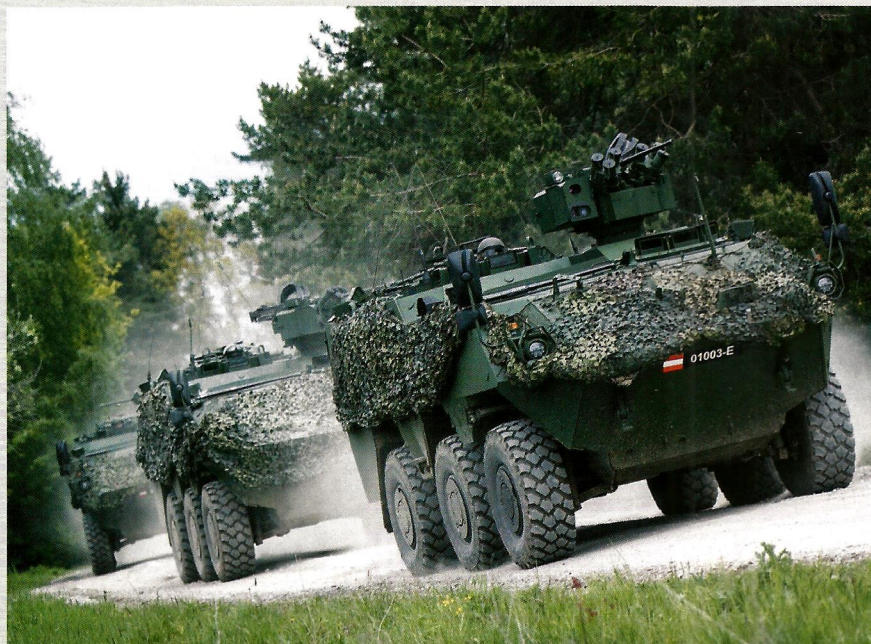
MODERNES GERÄT Neue Fahrzeuge wie die kürzlich beschafften Mannschaftstransporter Pandur Evolution tragen ganz entscheidend zum Schutz unserer Soldatinnen und Soldaten bei.

Definitiv. Aktuelle Umfragen bestätigen uns, dass die Attraktivität des Bundesheeres gestiegen ist, aber auch unsere Akzeptanz in der Zivilgesellschaft. Im Zuge der breiten Unterstützungsmaßnahmen während der vergangenen Corona-