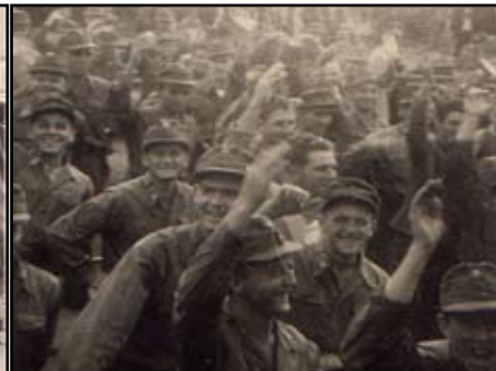
Ein freundlicher Gruß der in Spittal zurückbleibenden Kameraden

Für die Verlegung des Vorkommandos sollte ein durchgehender Waggon von Spittal nach Krems geführt werden. Es wurde jedoch vom Chef des Stabes der 7. Jägerbrigade, MjrdhmD Lüttendorf ein besonders schöner Waggon geordert, der jedoch nicht durch den Göttweiger Tunnel geführt werden konnte. Es musste daher kurzfristig in St. Pölten in einen andern kleineren Waggon umgestiegen werden. Originalton Juster: „Wir kamen daher wie die Zigeuner, manche Gegenstände mussten aus Platzmangel aus dem Fenster gehalten werden.“