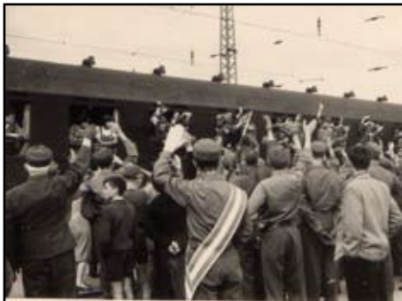
Abschied am Bahnhof