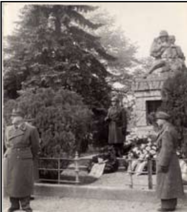
Kranzniederlegung beim Kriegerdenkmal in Mautern. Ehrenposten, li. Altziebler, re. Müller

Traditionell ist auch die Teilnahme des österreichischen Bundesheeres bei den Gedenkfeiern zu Allerseelen in Mautern. Im Bild der Brigadekommandant Oberst Franz Zejdlik bei der Kranzniederlegung im Jahr 1957.