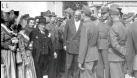
Goldhauben und Trachten begrüßen die jungen Soldaten