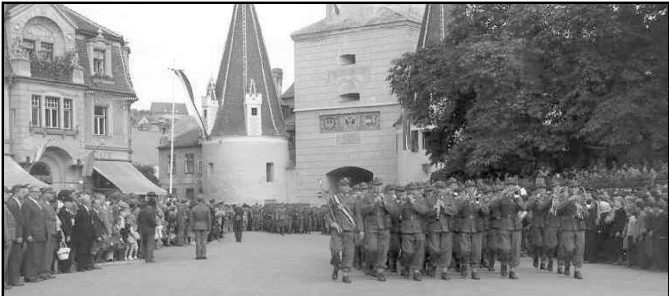
Dieser bedeutende Tag für Krems, endete mit einer Defilierung beim Steinertor, welche durch die Militärmusik begleitet wurde