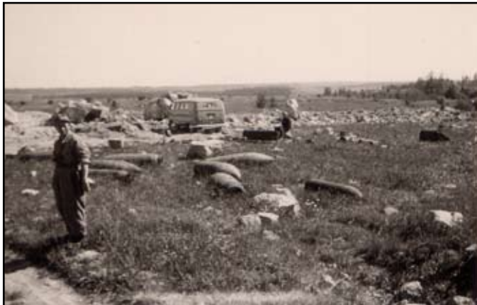
Sprengkörper aller Art (Granaten, Bomben, Handgranaten) wurden gefunden und mussten entschärft werden