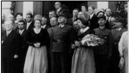
Die Ehrengäste vor dem Kremser Rathaus