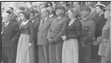
Unzählige Menschen warteten auf den Vorbeimarsch der Feldjäger