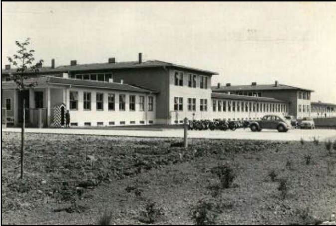
Die neuen Unterkünfte in der Raabkaserne Mautern

Im März 1959 übersiedelte die 1./FJgB 9 in den 2. Block der neu errichteten Unterkünfte in der Kaserne Mautern. Als Nachfolger zog die 1./PiB3 (später PzPiKp/PzStbB3) in die Kaserne Krems.