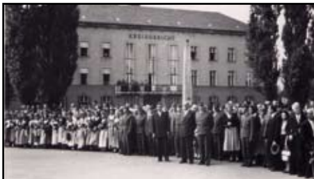
Wachauerinnen des Gesangs und Orchestervereins warten auf die Parade