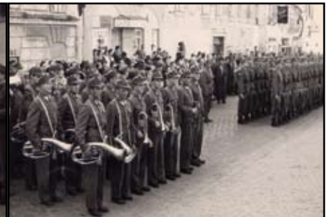
Die Musik des Wachbataillon aus Wien begleitete den Festakt in Horn