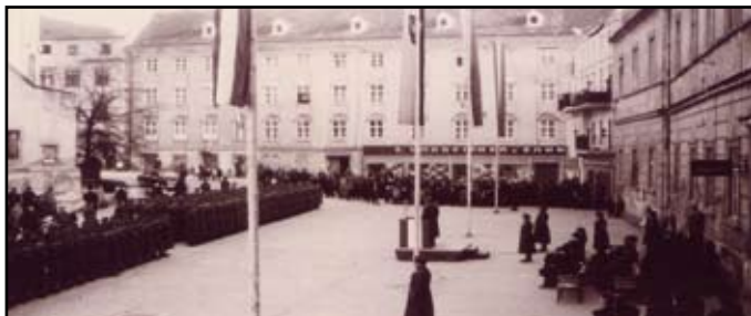
Der Kremser Pfarrplatz war am 15. Oktober Schauplatz der Angelobung des ersten Einrückungstermines in der 2. Republik

Nach dem Festakt nahmen die Ehrengäste die Parade der Feldjäger vor dem Steinertor ab.