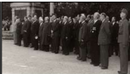
Die Honoratioren der Stadt Krems