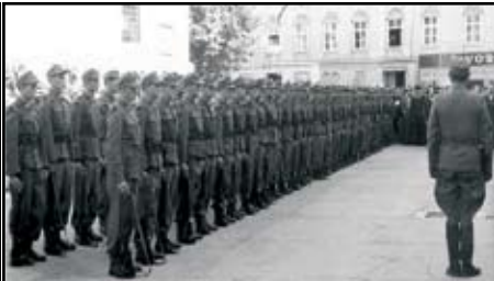
Die angetretene Truppe am Kremser Pfarrplatz