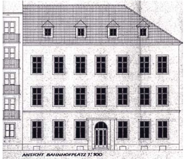
Frontansicht des Bahnhofhotels am Bahnhofplatz 10