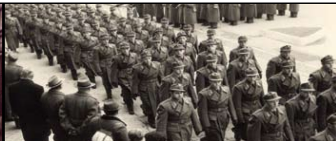
Am 12. Dezember leisteten die 350 Jungmänner aus Horn den Treueeid auf die Republik