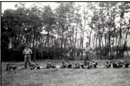
Bereits während der Ungarnkrise 1956 stand das FjB in seinen Garnisonen in Alarmbereitschaft