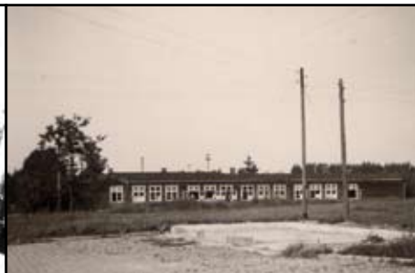
Als Unterkunft diente dem FjB 9 bei Verlegungen nach Allentsteig das „Ledigenheim“