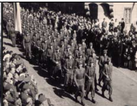
Defilierung am Sparkassenplatz in Horn