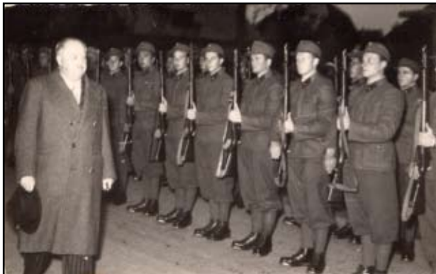
Bundeskanzler Ing. Julius Raab beim Abschreiten der Front

In dieser Aufstellungsphase besuchte auch Bundeskanzler Ing. Julius Raab die Garnison Spittal an der Drau.