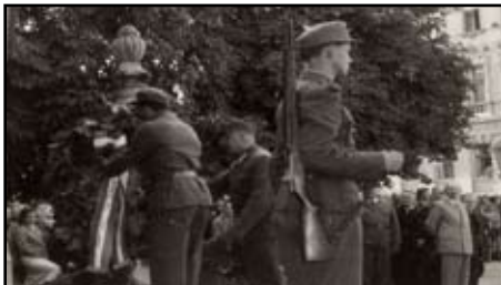
Kranzniederlegung vor dem Sappeur- u. Pionierdenkmal