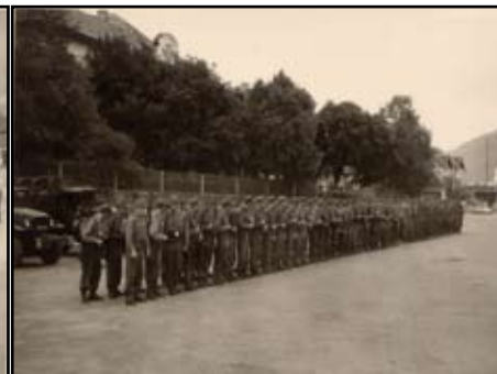
Warten auf den Zug ins neue, unbekannte „Land“